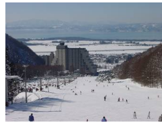
ロイヤルクリスティーコース