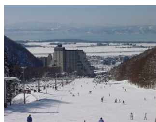
ロイヤルクリスティーコース