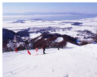
チャイニーズダウンヒルコース