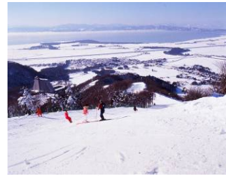
チェーンズダウンヒルコース